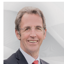
STEPHAN KOHLER Aufsichtsrat

Ehem. GF Deutsche Energie-Agentur GmbH (dena)